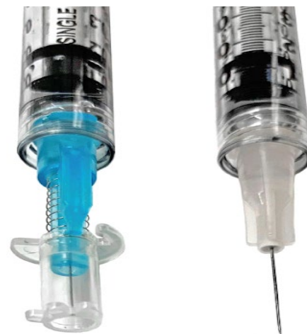
SteriCap®33 Gauge Vs Ago Standard da 30 Gauge

Durante le iniezioni intravitreali, SteriCap® protegge l'ago fornendo una barriera meccanica contro qualsiasi tipo di contaminazione con l'ambiente esterno; il meccanismo a molla garantisce un'iniezione rapida ed indolore senza alcun tipo di traccia o segno sulla congiuntiva.